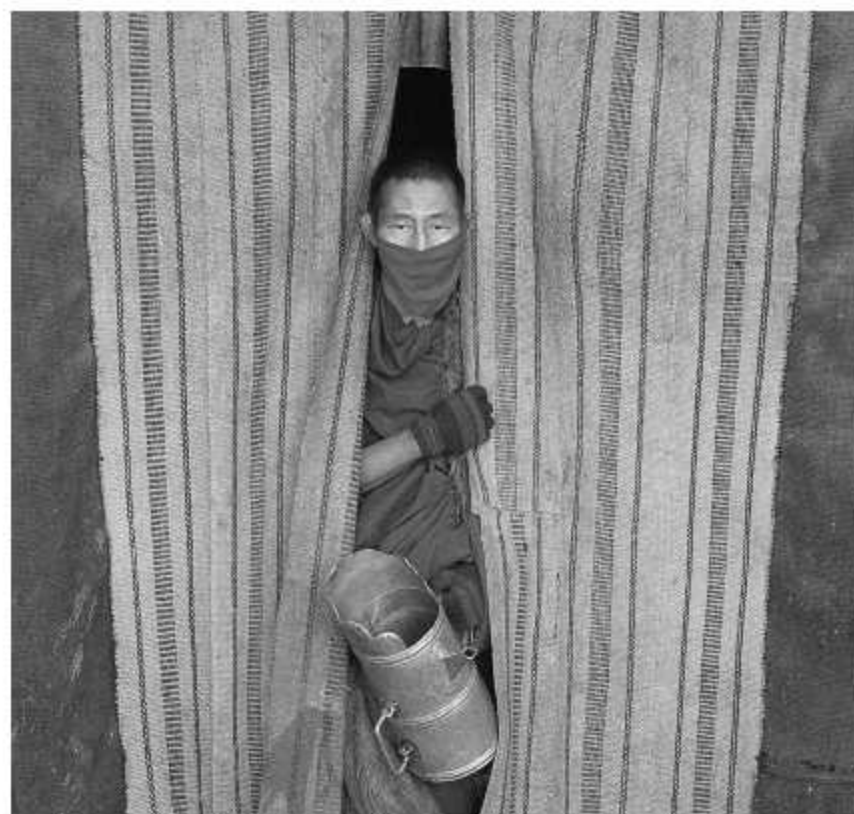
Montagem com base de chá na mão (Qinghai, 2010)