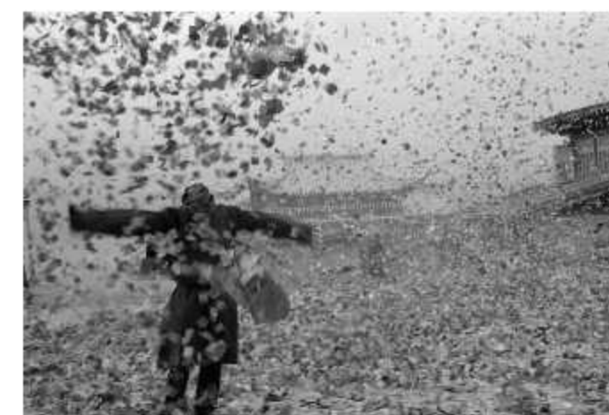
Penitentes espalhando Longda (Sichuan, 2006)