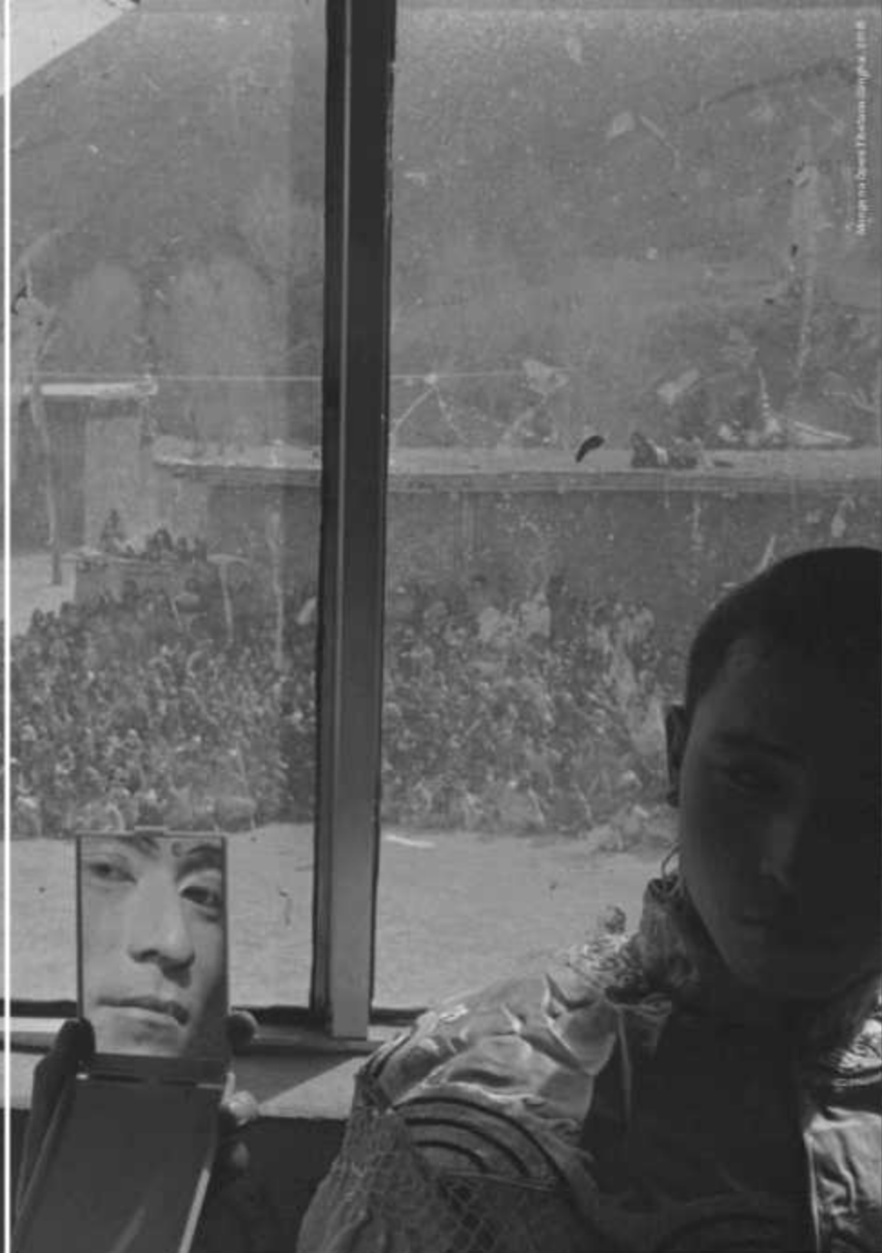
Montagem de João Miguel Barros, 2010

Na importante relação entre a natureza e a fé religiosa, misturo-me na vida pessoal das pessoas religiosas com respeito e crença para registar e capturar os momentos. Fico com elas e aguardo pacientemente pelos melhores momentos.