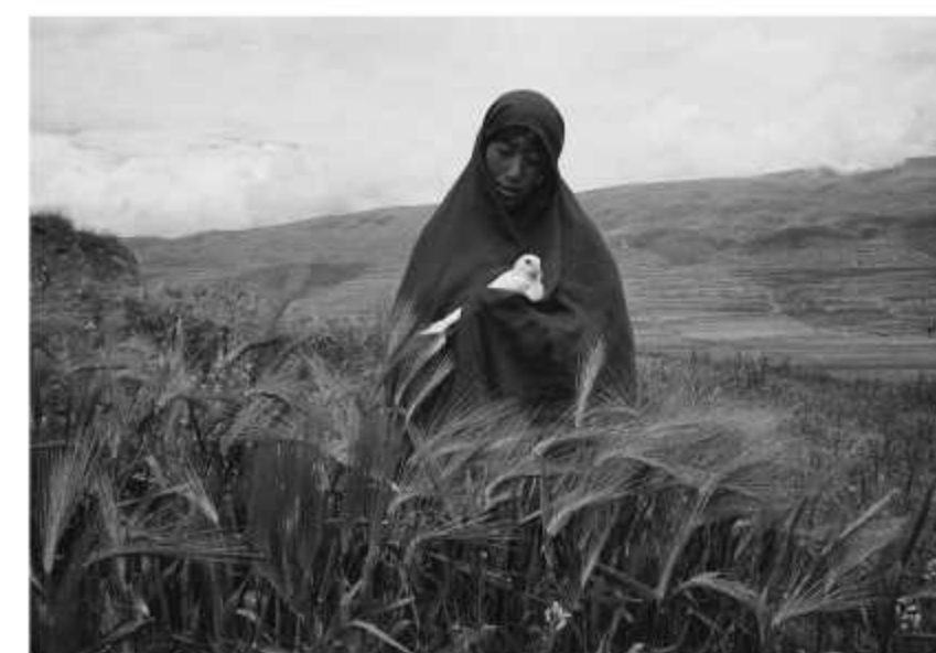
Mulher segurando uma pombo (Sichuan, 2006)

"As minhas fotografias focam-se mais na espiritualidade da vida religiosa; é uma forma de fotografia espiritual. Entre o material e o espiritual, eu escolheria o espiritual. É perigoso se as pessoas gananciosas não forem conduzidas espiritualmente no mundo material. O que é uma sociedade? Quasi é a dinâmica social? Qualquer sociedade civilizada necessita de ter fé. A fé direciona a alma para se aperfeiçoar. Quanto mais desenvolvida a sociedade e mais dinâmica é, mais precisamos do consolo e do calor da fé. Quando eu estava a fotografar a vida religiosa no Tibete, foi o brilho da tranquilidade e a calma que a sociedade chinesa necessita ver e sentir. Estas são as imagens poéticas que procuro."